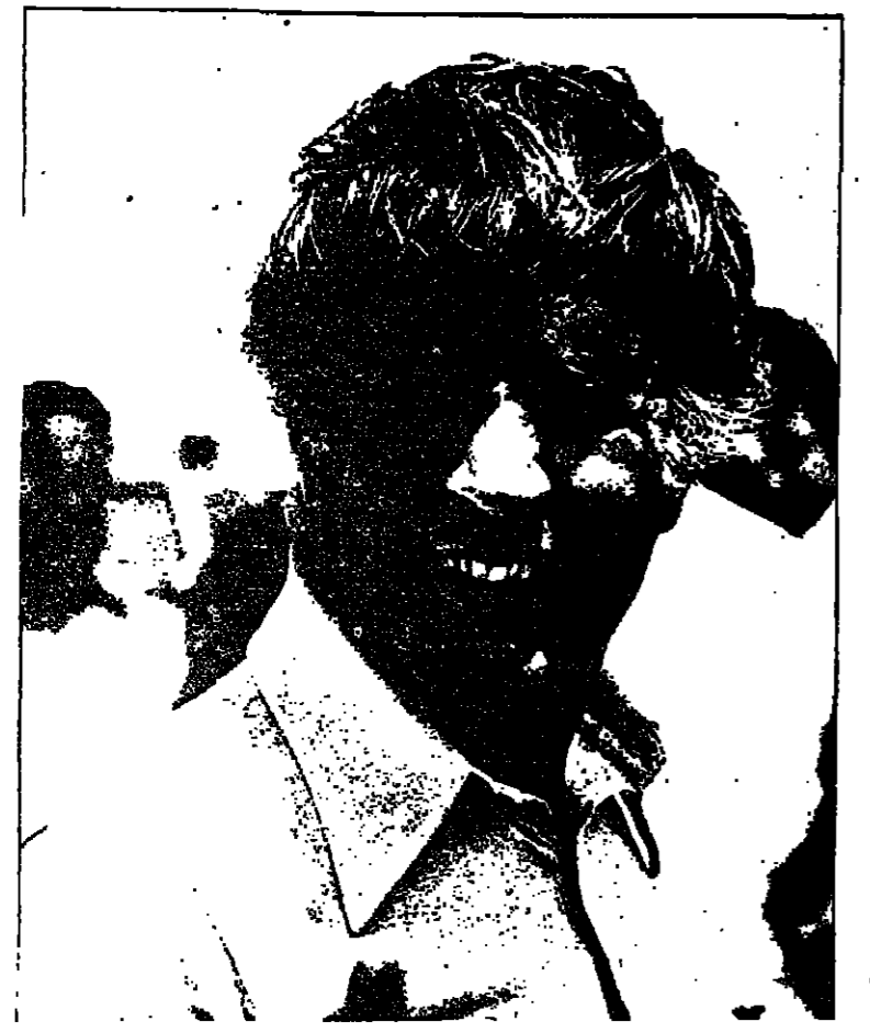
العقاد : صلاح الدين قريبا

لكن صريحين مع انفسنا ، وايضا مع الآخرين ، حتى نخدم الاهداف السامية التي ولدتنا من اجلها . . . ولكي يختم كل انسان بما اوتي من اجتهاد وعطاء في رحلته الحياتية عبر هذا الكون .